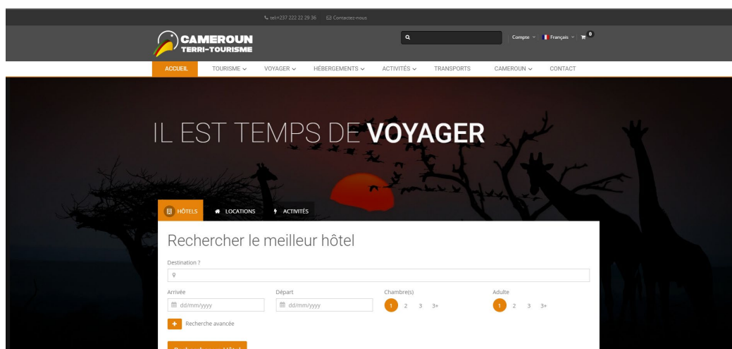
Portail Terri-Tourism (bêta) : https://www.visit-cameroun.com