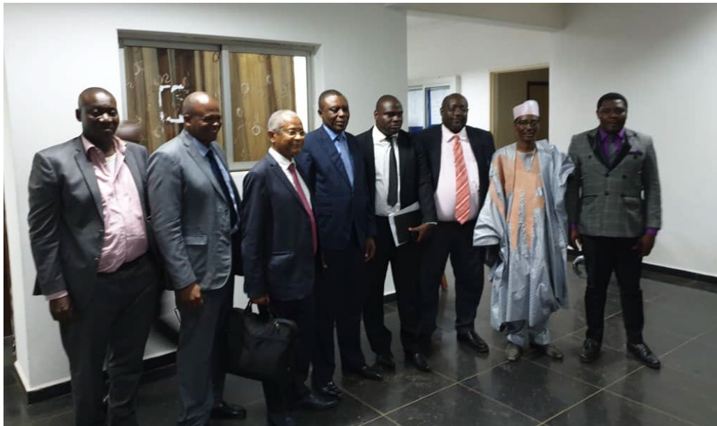
Avec les directeurs de l'APME

Le partenariat avec l'APME va permettre la mobilisation des ressources mutualisées de CIOA au bénéfice des entreprises camerounaises, par le biais de l'Agence.