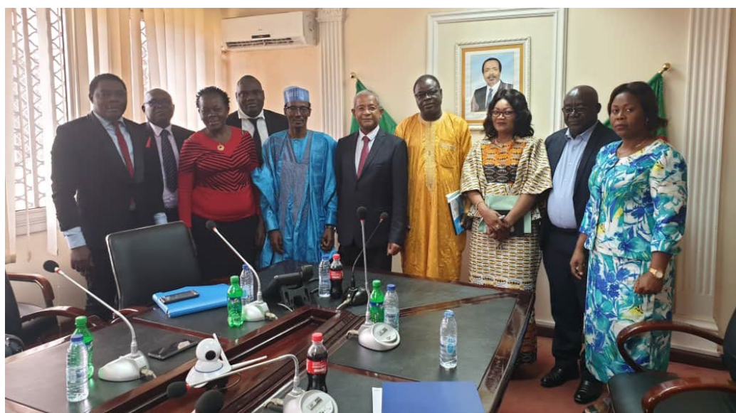
Séance de travail avec l'équipe des directeurs du Tourisme du Ministère du Tourisme

Les discussions ont permis de créer les conditions pour le déploiement des étapes suivantes pour amener le pays à moderniser son infrastructure d'accueil, former les jeunes cadres et les personnels de cette industrie, inclure la population pour qu'elle tire aussi parti du décollage de cette industrie.