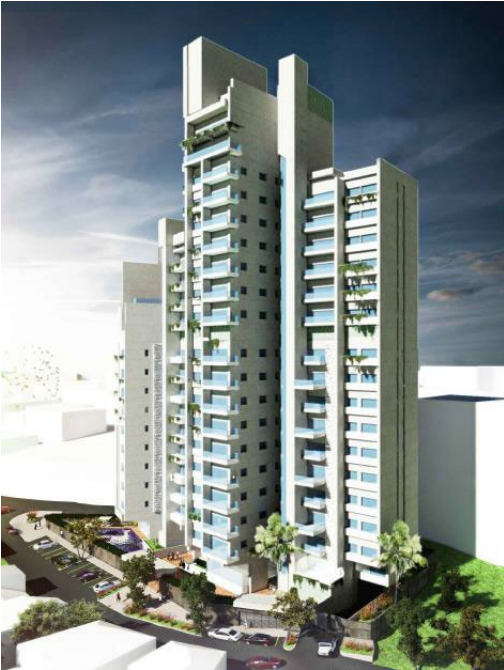
Un projet de classe internationale de 90 logements de prestige en plein centre de la Capitale